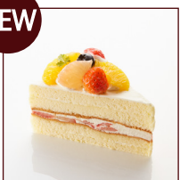
フルーツショート ¥453