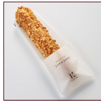
クロカンシュー ザクザク ¥216