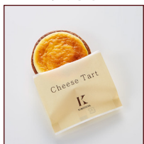
ブルーベリー チーズタルト ¥216