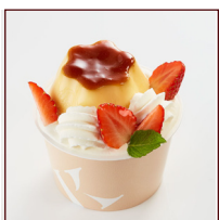
ダブルプリンパフェ ¥432