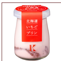
北海道いちごプリン ¥367