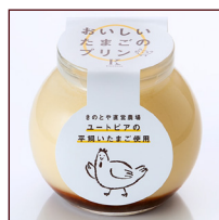
おいしいたまごのプリン ¥378