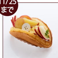
さつまいもとりんごの オムケーキ ¥518