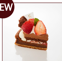
苺とチョコレートのタルト ¥496