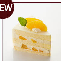
オレンジクリーム ¥388