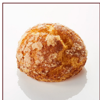
深焼シュークリーム ¥194