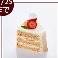
りんごと紅茶のケーキ ¥432