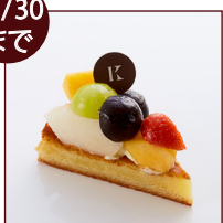
秋のフルーツタルト ¥540