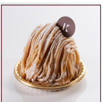
マロンモンブラン ¥604