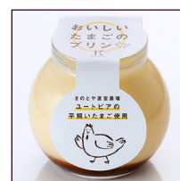
おいしいたまごのプリン ¥378