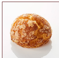
深焼シュークリーム ¥194