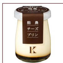
酪農チーズプリン ¥324