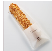
クロックンシュー ザクザク ¥216