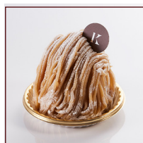
マロンモンブラン ¥604