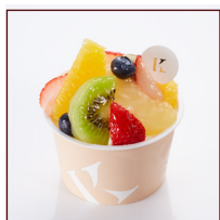
フルーツカップケーキ ¥486