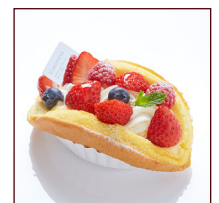
フロマージュ ベリーオムレット ¥583