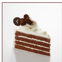
ショコラノワール ¥388