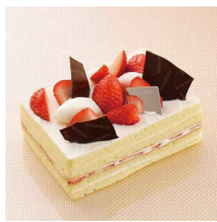
ハッピーイチゴショート