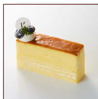
バイクフロマージュ ¥410