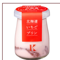
北海道いちごプリン ¥367