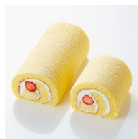
いちごプリンロール