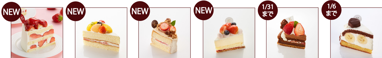
ストロベリークイーン ¥648