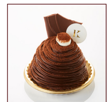
モンブランショコラ ¥410