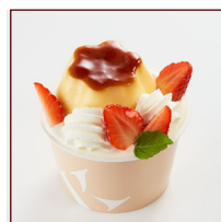
ダブルプリンパフェ ¥432