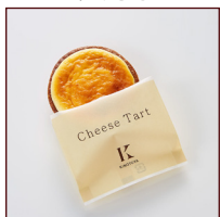
ブルーベリー チーズタルト ¥216