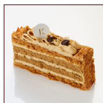
カフェミルフィーユ ¥388