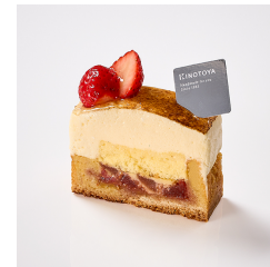
りんごのシブースト 11/26から ¥690