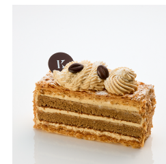
カフェミルフィューユ ¥520