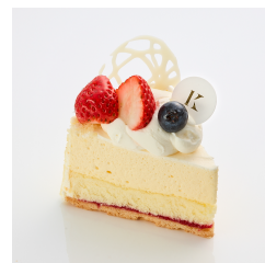
レアチーズケーキ ¥600