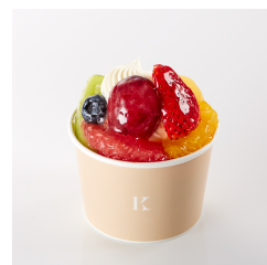
フルーツアラモード ¥610