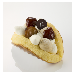
マロンオムケーキ 12/9まで ¥870