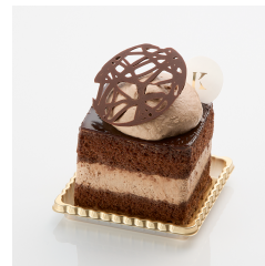
ロイヤルチョコレート ¥510