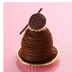
ショコラモンブラン NEW ¥670