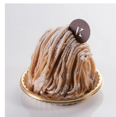
マロンモンブラン ¥670