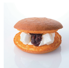
極上どらやき 11/20～11/30休止 ¥360