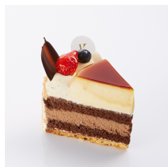
プリンショコラケーキ 11/30まで ¥690