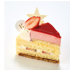
フリーズブルージュ 12/1から ¥680