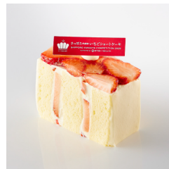
さっぽろneoいちご ショート ¥590