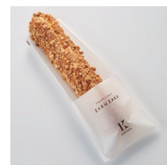
クロッカンシュー ザクザク ¥260