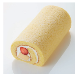
いちごプリンロール 1本(約18cm) ¥2,100