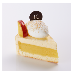
スイートポテトケーキ 11/25まで ¥610