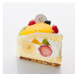
フルーツズコット 11/30まで ¥790