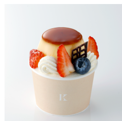
カスタード プリンパフェ ¥560