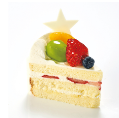
フルーツショート 12/1から ¥650