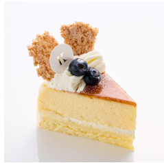
バイクドチーズケーキ 5/20から Take out Eat in ¥650/¥662