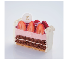
ガトーフレーズ Take out Eat in ¥700/¥713