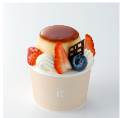
カスタード プリンパフェ Take out Eat in ¥650/¥662