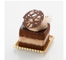
ロイヤルチョコレート Take out Eat in ¥570/¥580