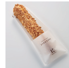
クロックアンシュール ザクザク Take out Eat in ¥290/¥295