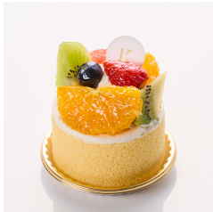
たっぷり フルーツロール Take out Eat in ¥750/¥764