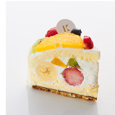
フルーツゾット Take out Eat in ¥790/¥805