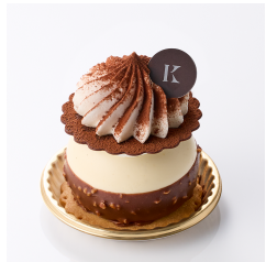
スペチアーレ ティラミス Take out Eat in ¥740/¥754