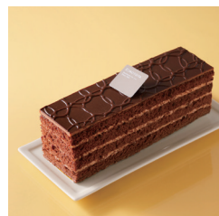
ショコラボックス 5/31まで 約18cm ¥1,850