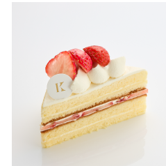
イチゴショート Take out Eat in ¥590/¥601