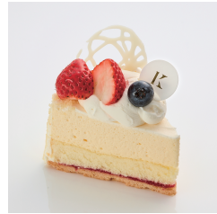
レアチーズケーキ 5/12まで Take out Eat in ¥670/¥683