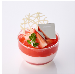
いちごのヴェリーヌ 5/13から Take out Eat in ¥720/¥733