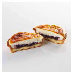
ブルーベリー チーズタルト Take out Eat in ¥320/¥326