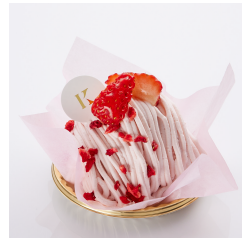
まるごと苺の モンブラン Take out Eat in ¥690/¥702