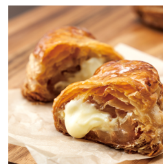
焼きたてカスタード アップルパイ Take out Eat in ¥450/¥458 (白石本店・琴似店・ファーム店・ポールタウン店限定)