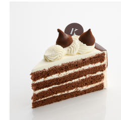
ショコラノワール Take out Eat in ¥530/¥540