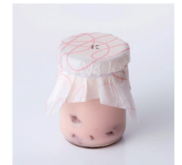
いちごプリン Take out Eat in ¥450/¥458