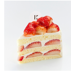
ストロベリークイン 5/31まで Take out Eat in ¥860/¥876