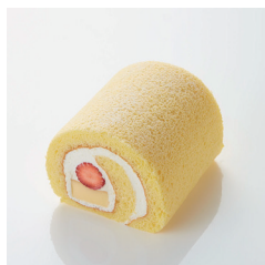
いちごプリンロール ハーフ(約9cm) ¥1,200