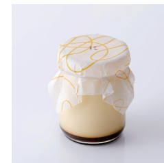
たまごプリン Take out Eat in ¥420/¥427