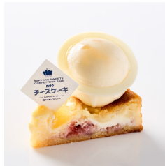
さっぽろneo チーズケーキ Take out Eat in ¥720/¥733