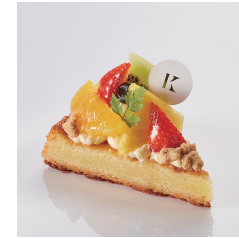
彩りフルーツタルト Take out Eat in ¥700/¥713