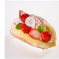
贅沢 いちごのオムケーキ 6/2まで Take out Eat in ¥870/¥886