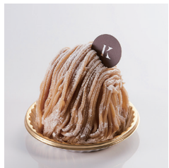
マロンモンブラン Take out Eat in ¥710/¥723