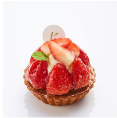
いちごのタルト 5/19まで Take out Eat in ¥830/¥845