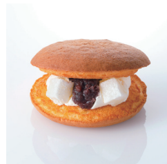
極上どらやき Take out Eat in ¥380/¥387