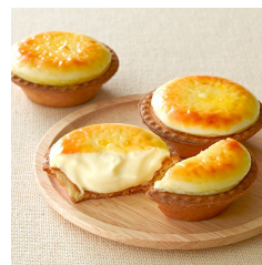
焼きたてチーズタルト Take out Eat in ¥270/¥275 (大丸店・東苗穂工場直売店を除く)