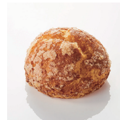
深焼シュークリーム Take out Eat in ¥280/¥286